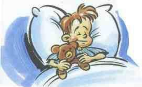
ausreichender und regelmäßiger Schlaf