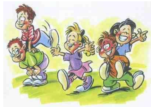
ausreichend Zeit zum Spielen und Toben mit Freunden lassen